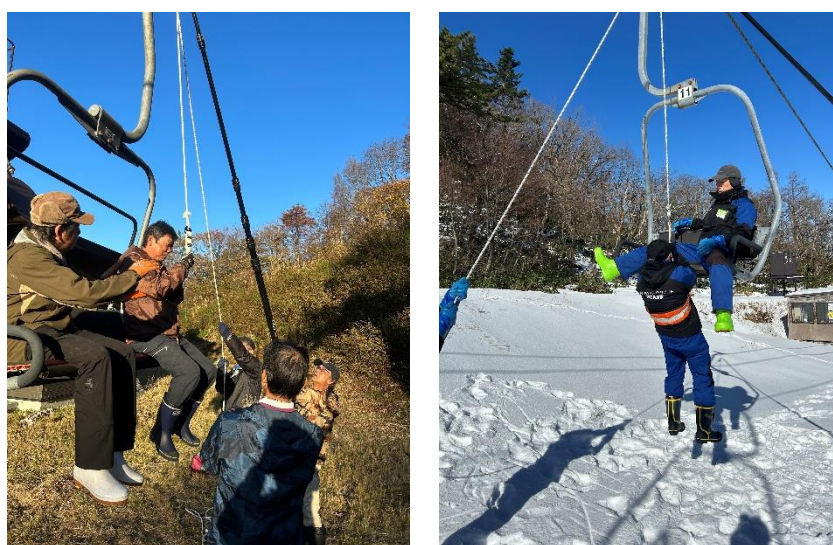
シーズン初期救助訓練の様子