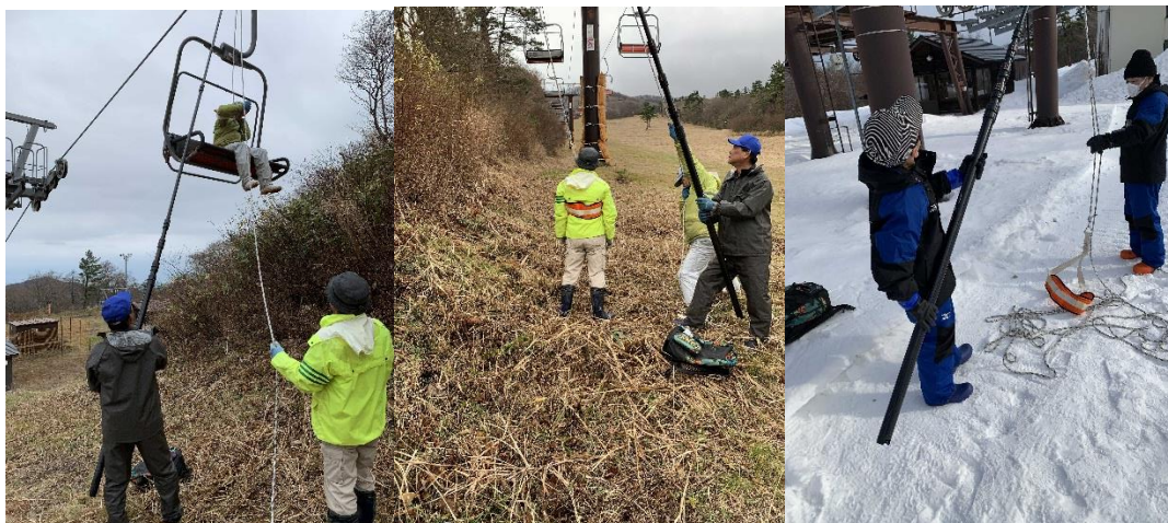
シーズン前救助訓練の様子