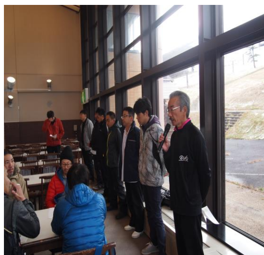
冬季事業員研修会（中の原スキーセンター 11月29日）