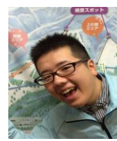
横向き・背景に柄