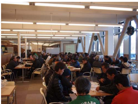
12月2日 サービスマナーUP講習会

不良索輪 OH、ゴムライナー、ベアリング交換 全索輪グリスアップ 原動装置等オイル交換・グリスアップ