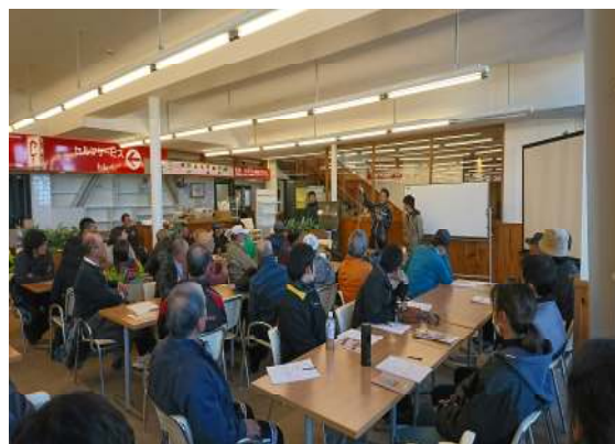
12月2日 救助訓練用具の説明